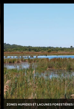
ZONES HUMIDES ET LAGUNES FORESTIÈRES