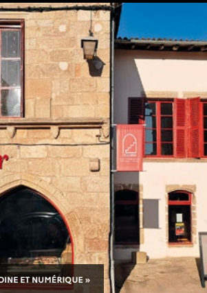
DINE ET NUMÉRIQUE »