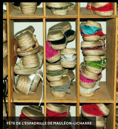
FÊTE DE L'ESPADRILLE DE MAULÉON-LICHARRE