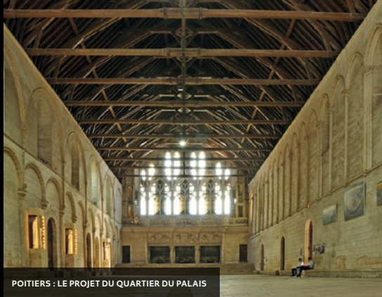
POITIERS : LE PROJET DU QUARTIER DU PALAIS