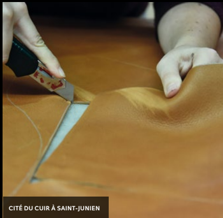
CITÉ DU CUIR À SAINT-JUNIEN