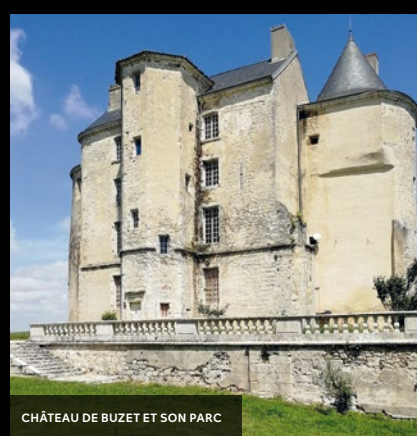
CHÂTEAU DE BUZET ET SON PARC