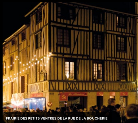
FRAIRIE DES PETITS VENTRES DE LA RUE DE LA BOUCHERIE