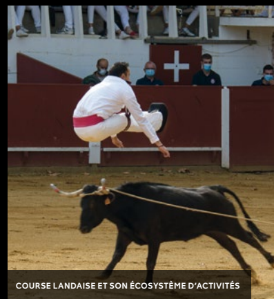
COURSE LANDAISE ET SON ÉCOSYSTÈME D'ACTIVITÉS