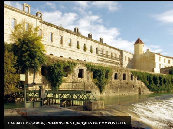
L'ABBAYE DE SORDE, CHEMINS DE ST JACQUES DE COMPOSTELLE