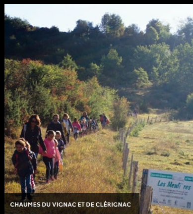
CHAUMES DU VIGNAC ET DE CLÉRICNAC