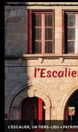
L'ESCALIER, UN TIERS-LIEU PATRIMONIAL