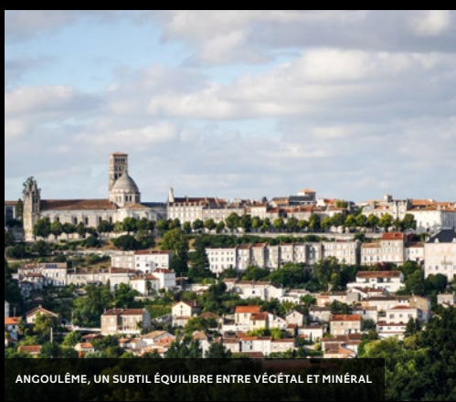
ANGOULÊME, UN SUBTIL ÉQUILIBRE ENTRE VÉGÉTAL ET MINÉRAL