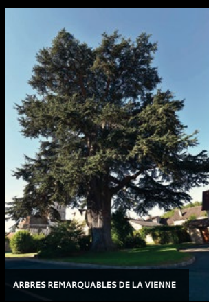
ARBRES REMARQUABLES DE LA VIENNE