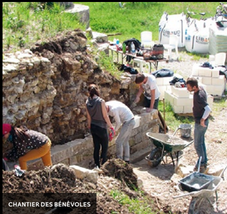
CHANTIER DES BÉNÉVOLES