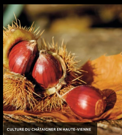
CULTURE DU CHÂTAIGNER EN HAUTE-VIENNE