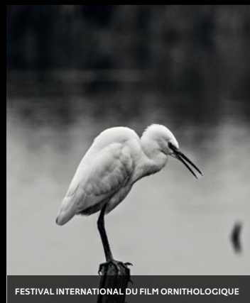
FESTIVAL INTERNATIONAL DU FILM ORNITHOLOGIQUE