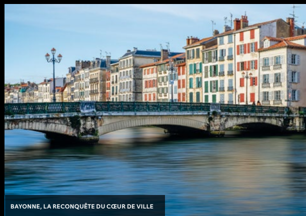
BAYONNE, LA RECONQUÊTE DU CŒUR DE VILLE