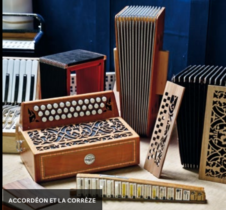
ACCORDÉON ET LA CORRÈZE