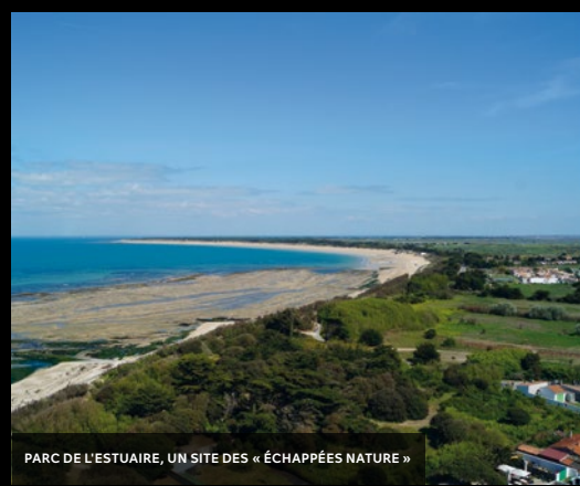
PARC DE L'ESTUAIRE, UN SITE DES « ÉCHAPPÉES NATURE »