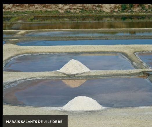
MARAIS SALANTS DE L'ÎLE DE RÉ

Le CESER présente 27 initiatives qui sont autant d'exemples que les patrimoines lorsqu'ils sont pensés ainsi, peuvent être mobilisés pour générer, à leur échelle, des dynamiques territoriales ! Ces initiatives illustrent l'impact des patrimoines sur les territoires. Le CESER met en lumière les bonnes pratiques, les leviers et les freins pour inspirer les collectivités souhaitant faire du patrimoine une composante de leur projet de territoire. La fresque de photos ci-après illustre les 27 initiatives présentées dans les fiches du rapport.