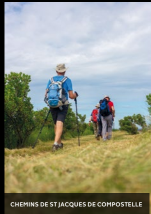
CHEMINS DE ST JACQUES DE COMPOSTELLE