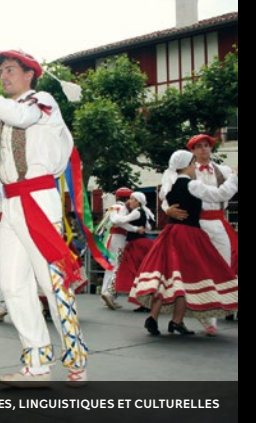
ES, LINGUISTIQUES ET CULTURELLES