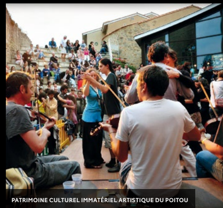
PATRIMOINE CULTUREL IMMATÉRIEL ARTISTIQUE DU POITOU