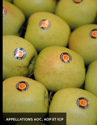
APPELLATIONS AOC, AOP ET IGP